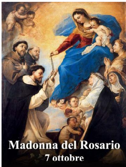
Madonna del Rosario 7 ottobre

IN PREPARAZIONE ALLA FESTA DELLA MADONNA DEL ROSARIO