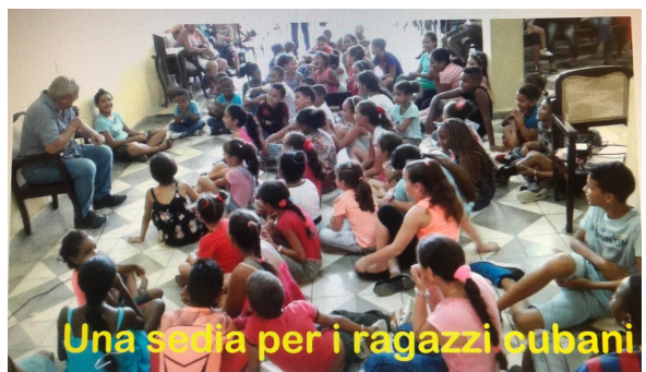
Una sedia per i ragazzi cubani

Comunichiamo che il progetto missionario a favore della Missione di don Adriano a Cuba si sta realizzando anche grazie al contributo della nostra Parrocchia di euro 3.000